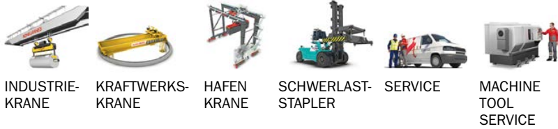
INDUSTRIE-KRANE KRAFTWERKS-KRANE HAFEN KRANE SCHWERLAST-STAPLER SERVICE MACHINE TOOL SERVICE